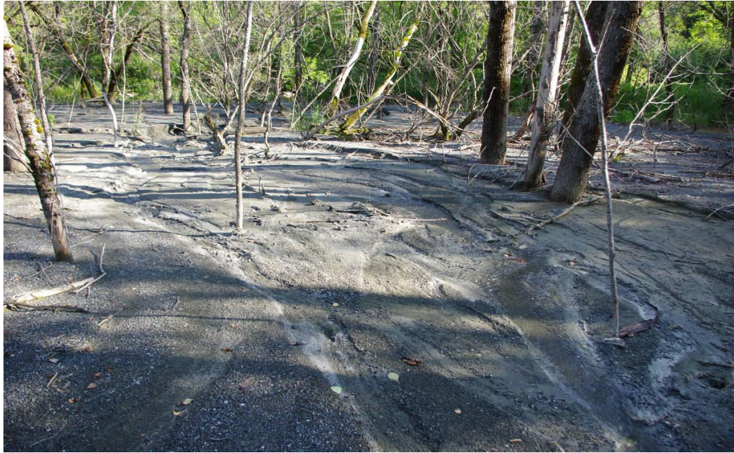
Photo 3 Un grand volume de sédiments se dépose dans les zones de ralentissement du courant, perturbant l'écosystème naturel.