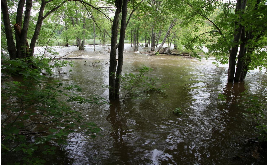
Photo 9 Lors des périodes de forte hydraulité, la totalité du déversoir contribue à l'évacuation de la crue. On remarque la forte rugosité causée par la présence d'arbres et de débris.