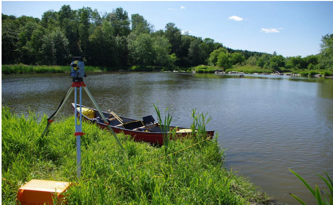
Photo 7 Vue de l'amont sur le déversoir. On remarque la présence d'une végétation abondante dans le déversoir.