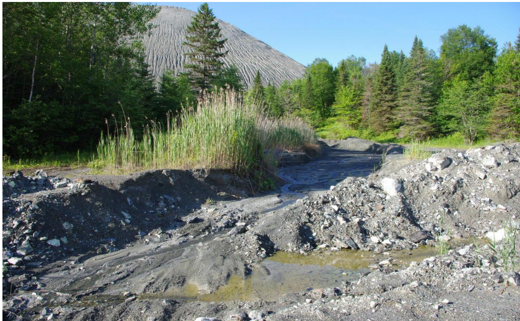
Photo 2 Encore aujourd'hui, les dépôts miniers sont responsables d'un apport important de sédiments vers le réseau hydrographique.

l'érosion des surfaces. D'ailleurs, la région Chaudière-Appalaches est reconnue pour sa forte intensité de précipitations et pour sa dynamique érosive supérieure à la moyenne québécoise.