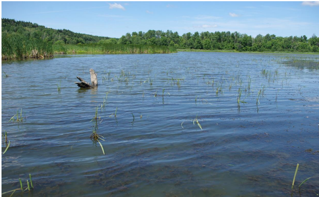
Photo 1 Vue générale sur l'Étang Stater.

L'Étang Stater est situé dans la municipalité d'Irlande. Les plans 2 et 3 présentés en annexe donnent un aperçu de la localisation de la zone visée. Plus précisément, les coordonnées géographiques du centre de la digue sont N 46° 04' 36'' W 71° 28' 36''. L'exutoire de l'Étang Stater est facilement accessible par la route provinciale 265 et par un chemin privé localisé sur la crête de la digue. La photo 1 donne un aperçu du plan d'eau.