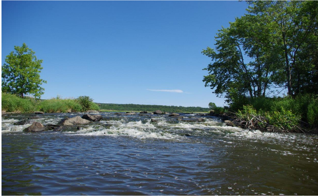
Photo 6 Vue de l'aval sur le déversoir.