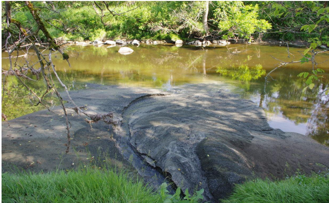
Photo 4 Les sédiments forment de vastes deltas dans les cours d'eau avant d'être transportés plus en aval.