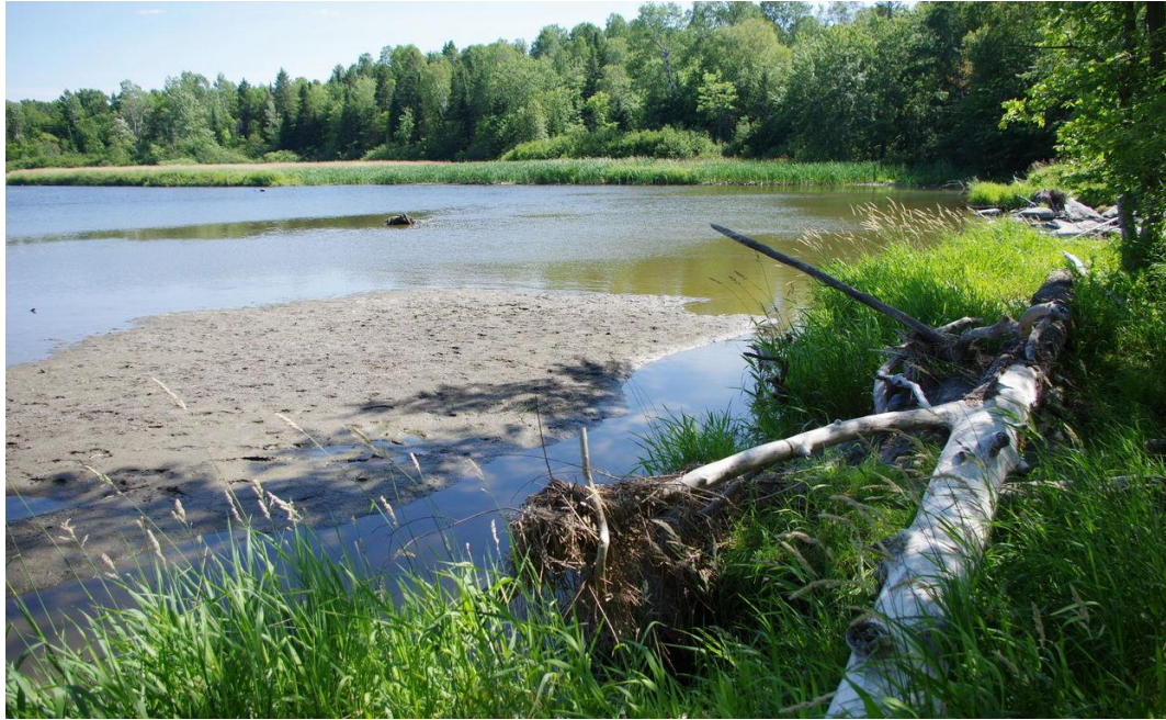
Photo 8 Des corps flottants peuvent partiellement obstruer le déversoir.