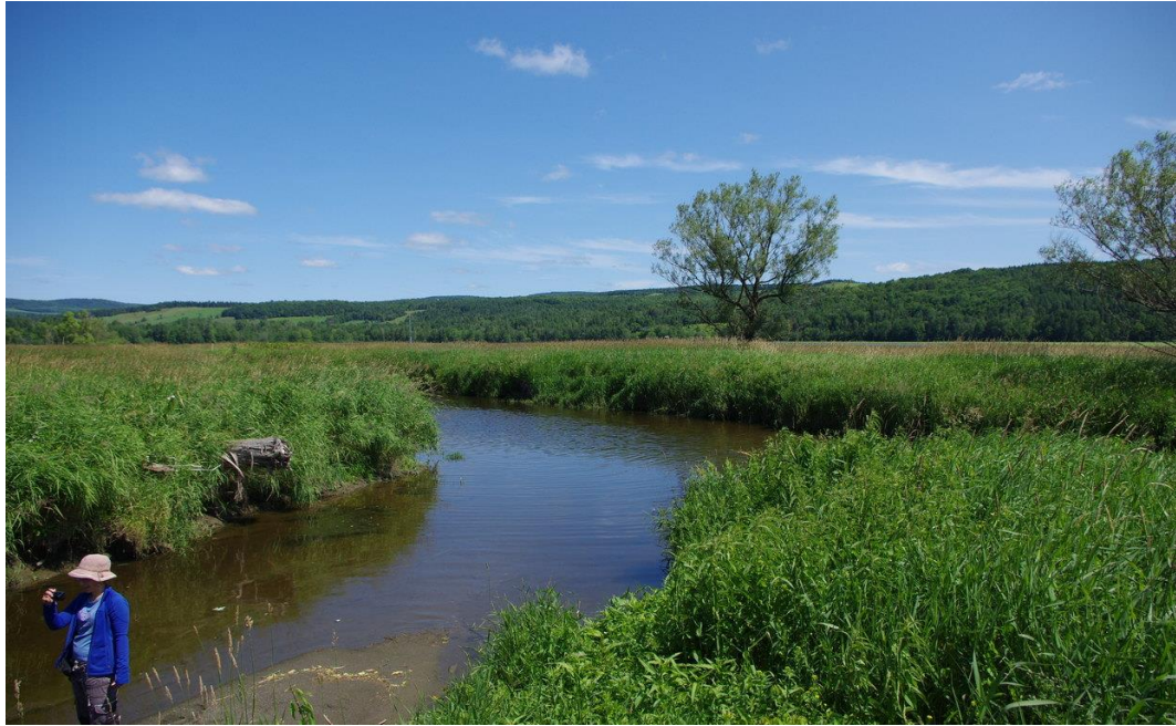
Photo 5 Un milieu anciennement lacustre est actuellement rempli par des sédiments. Le réseau hydrographique est bien défini.